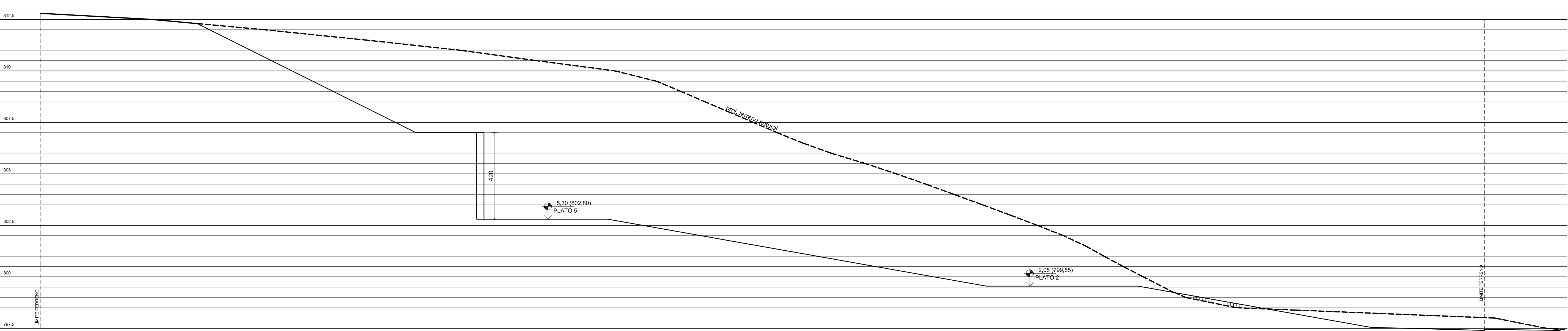
SEÇÃO BB ESC: 1/100